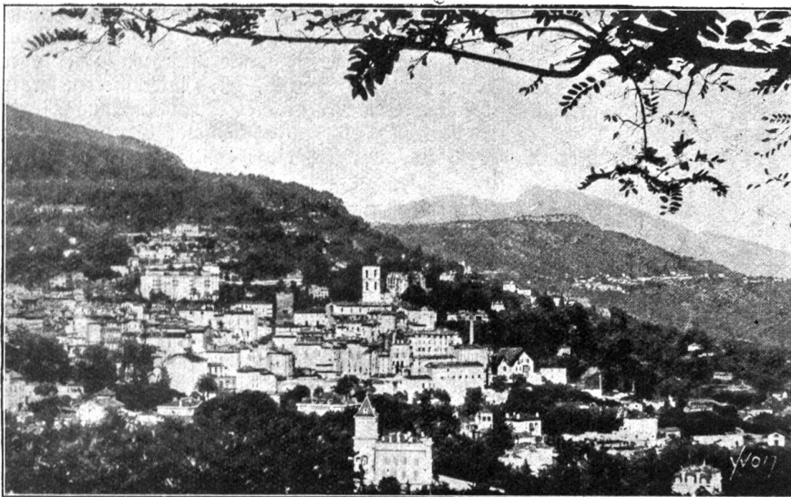
Grasse (Alpes-Maritimes). — Generalansicht.

Aber 3000 Kilogramm Rosen sind im günstigsten Falle notwendig, um ein Kilogramm Rosenöl zu gewinnen. Das Rosenöl wird durch Destillation der Blumenblätter mit Wasser gewonnen, es sammelt sich auf der Oberfläche des Wassers allmählich an. Obwohl nur sehr geringe Mengen des Oeles sich im Wasser lösen können, so reichen sie doch aus, um diesem einen sehr starken Duft zu verleihen. Die meisten Rosen von Grasse dienen zur Herstellung von Rosenpomade und werden zu diesem Zweck in Fett maceriert. Während solche Rosenpomade den fast unveränderten Duft frischer Blüten bewahrt, weicht das Rosenöl in seinem Wohlgeruch etwas von ihnen ab. Der Pomade entzieht man mit Alkohol das Esprit de Rose, eines der feinsten Parfüms. Außer den bereits genannten werden Veilchenblüten, Mimosen, Nelken, Reseden, Geranien, Zitronenmelisse, Estragon, Pfefferminze, Rosmarin, Lavendel und Thymian verarbeitet. Etliche davon wachsen wild und werden im Sommer von Frauen und Kindern auf den Hügeln der Umgebung gesammelt.