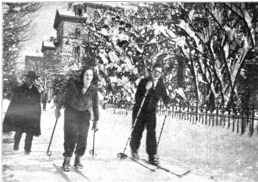
Der grosse Schneefall in Bern. Per Ski ins Bureau.

Man kann sich wundern, daß dem Begriff „nervös“ oft so wenig Gewicht beigelegt wird und die Nervosität von vielen kaum als Krankheit angesehen wird. Wer aber selbst unter nervösen Erscheinungen zu leiden hat, der fühlt sich meist nicht mit Unrecht getränkt, daß man ihn „nur“ nervös und womöglich launisch und unbeherrscht nennt. Der Nervengesunde vermag sich kaum eine richtige Vorstellung zu machen von den innern Spannungszuständen des Nervenschwachen, die ihn aus den verschiedensten Ursachen hindern, sich den äußern Lebensumständen richtig anzupassen. Der Nervöse wird durch Unruhe und Reizbarkeit oft auffällig kränkend und rücksichtslos gegen seine Umgebung, ohne es zu wissen oder zu wollen. — Man kann sich vorstellen, daß bei dem dichten Nervenetz, das außer der Haut, den Gelenken und Muskeln auch alle innern Organe der Brust und der Bauchhöhle durchzieht, der nervengeschwächte Mensch an zahlreichen Krankheiten leiden kann infolge des direkten Zusammenhangs zwischen den Nerven, den Blutadern und überhaupt den Organen des Körpers. Dadurch ferner, daß Gehirn, Rückenmark und Nervensystem ein Ganzes bilden, ist bei Nervenschwäche eine Beeinträchtigung nicht nur des körperlichen,