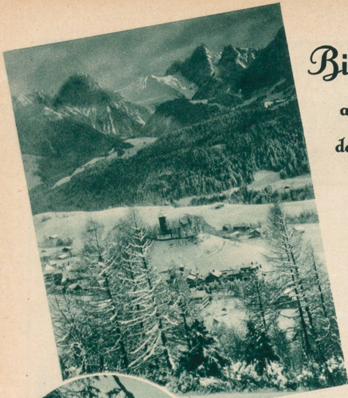
Bei Château d'Oex.