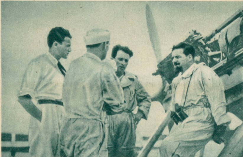
General Italo Balbo (an seinen Apparat gelehnt), der Chef des italienischen Flug- wesens, der ein Geschwader von 10 Wasserflugzeugen über den Ozean via Afrika nach Brasilien führte.