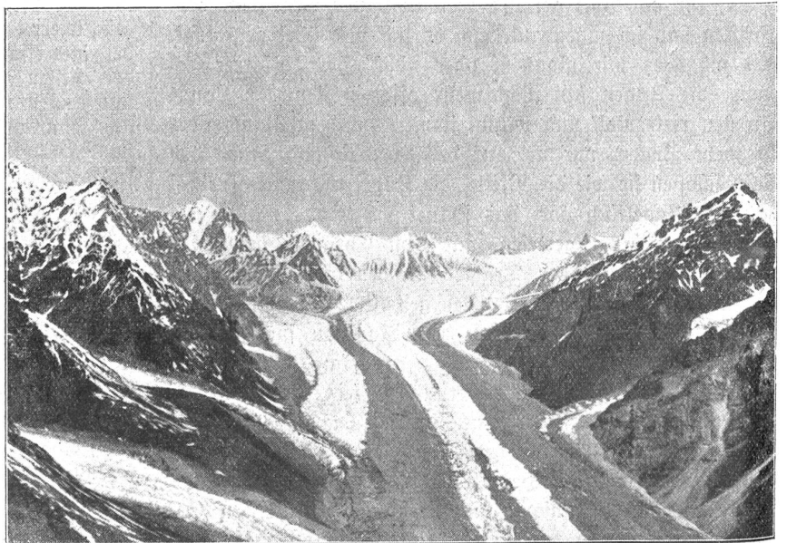
Im Zentralasiatischen Hochgebirge. — Nahezu 50 Kilometer langer Riefengletscher im Shyokgebiet.