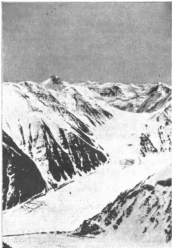
Im Zentralasiatischen Hochgebirge. — Weichgeschwungene Gletscherjoch erinnern da und dort an die Berneralpen.