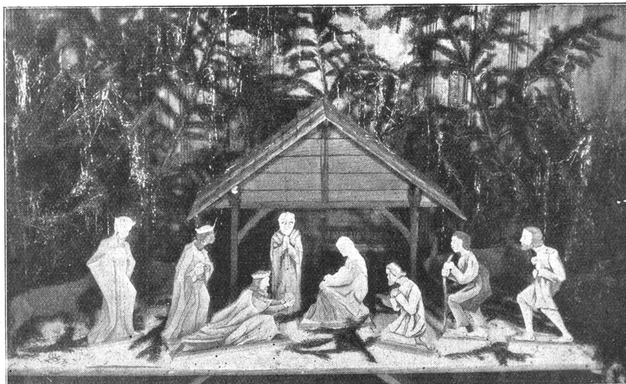
Weihnachtskrippe (protestantische Auffassung) aus Holz geschnitzt und bemalt.

(Schülerarbeit aus dem Handfertigkeitsunterricht des Herrn Habersaat.)