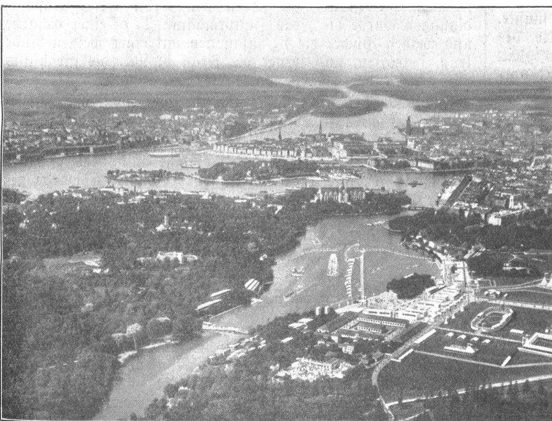
Luftbild von Stockholm mit dem Ausstellungsgelände im Vordergrund.

Gleich hinter dem Haupteingang wird das Auge durch die wunderbare Blumenpracht der Gärten entzückt, deren Boden dem nordischen Klima gemäß mit elektrischem Strom erwärmt wird. Der Hauptplatz ist als Raum für Vorstellungen, Sängereisen und andere Volksvergügen gedacht und wird in der Zwischenzeit mittels Hunderten von Blumenkästen in einen farbenprächtigen Garten verwandelt.