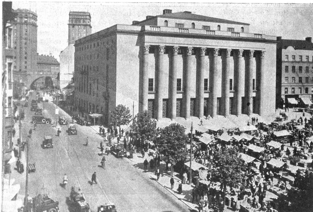
Das Stockholmer Konzerthaus.

Der fremde Ausstellungsbesucher ist begreiflicherweise voll gespannter Erwartungen auch für Stockholm, die Stadt der schönen modernen Bauten, und für das Land selber. Er wird schon auf der vielstündigen Fahrt zur Ausstellungstadt, erst durch die weiten Ebenen Schonen mit seinen wogenden Weizenfeldern, wohlhabenden Bauernhöfen und alten Rittergütern, dann durch die seen- und wälderreiche Landschaft Mittelschwedens starke Eindrücke empfangen. Schweden ist das Land der Ruhe und der Harmonie. Kaum stört irgendwo ein rauchender Fabrikschlott oder der Lärm eines lauten Betriebes den Frieden der Natur, die wie in einem tausendjährigen Dornröschenschlaf zu liegen scheint. Und doch hat Schweden eine hochentwickelte Industrie. Es weiß sie aber in seinem unendlich weiten Gebiete unsichtbar zu machen.