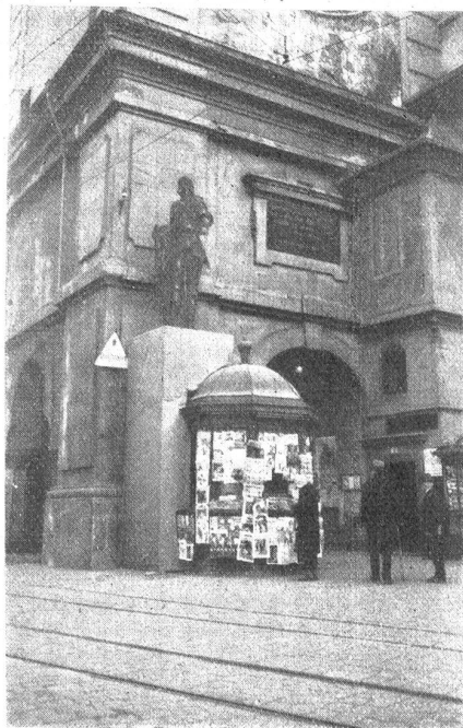
Wie sich das Bubenbergsdenkmal beim „Zytgloggen“ ausnehmen würde.

Kredner, Herr Obergerichtsschreiber Dr. Kehrli, setzte sich voll und ganz für die neuzeitlichen Bauarten ein. Er wies besonders darauf hin, daß das Bauen im weiteren Sinne eine wirtschaftliche und eine politische Frage sei und von diesem Standpunkt aus betrachtet werden müsse. Jeder Mensch hätte das Recht, gesund und froh zu wohnen. Auf diesem Gebiet fehle noch viel, besonders in der Altstadt, darum müsse auch in dieser Richtung weitergearbeitet werden.