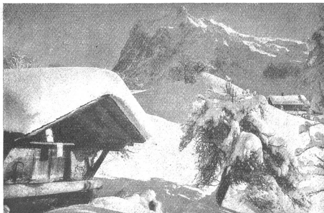
Bei Grindelwald im Winter.