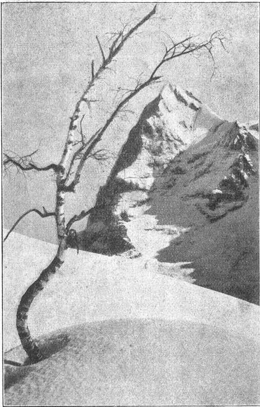
Mürren. Birke mit Eiger.

Wenn man von Interlaken, Grindelwald und Lauterbrunnen herkommt, dann tritt man für eine Spanne in die