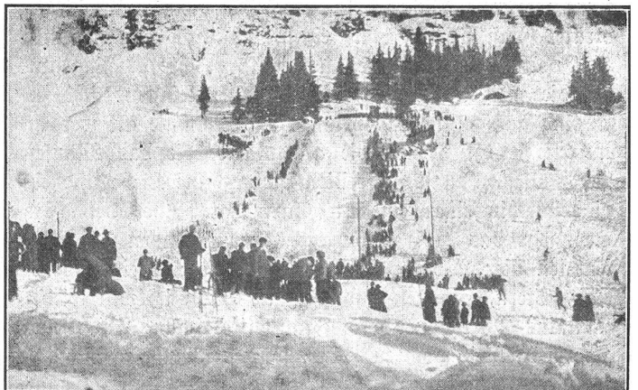
Skigelände bei Wengen.

Prächtig fährt es sich so mit den erprobten Hausfreunden, vorausgesetzt, daß die beiden nicht übereinander