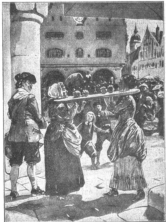
(Sig. 2.) Die Doppelgeige.

Einerseits kam die auch dem modernen Strafrecht als Nebenstrafe bekannte Entziehung bürgerlicher Ehrenrechte zur Anwendung. Dieser Strafe, die ja nicht die soziale Ehre des Verurteilten treffen soll, sondern ihm bloß solche Rechte