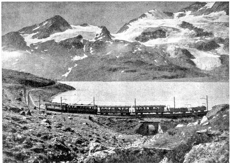
Bernina-Bahn am Lago Bianco vorbei.

Auf der Südseite fährt die Bahn in unerhört kühnen Kehren, die die wundervollsten Taleinblicke erschließen, hinunter ins Puschlav. Zuerst durch ein Seitentälchen, das Val Pila, mit den verschlungenen Schleifen der Grüm Alp in den waldumgebenen Talkessel von Cavaglia