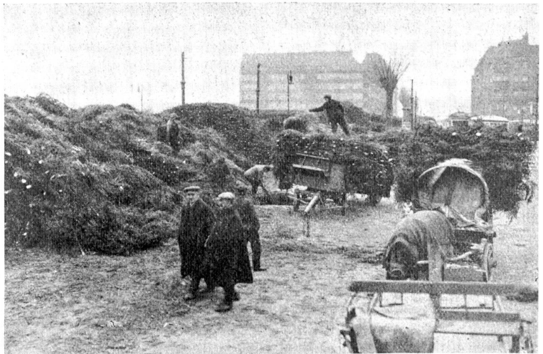
Ankunft der Weihnachtsbäume auf einem Berliner Cadeplatz, von wo aus dieselben den Händlern übergeben werden.

Der Mistel ist schon in der antiken und ebenso in der germanisch-nordischen Mythologie eine besondere Beachtung zu teil geworden und noch heute spielt sie in verschiedenen