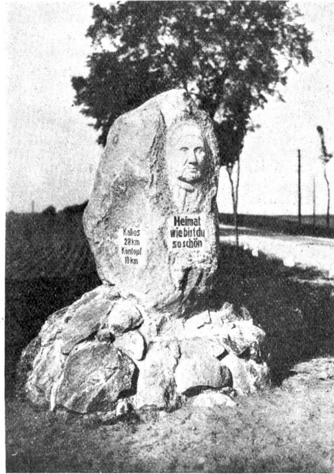
Ein aus Sindlingen errichteter Wegweiser an der Wangeriner Chaussee bei Dramburg.

Sonnen- und Schlechtwetterstörre. Der Linoleumboden dämpft den Schuhlärm. Es scheint wirklich nichts zu fehlen für ein glückliches, unbeschwertes Schulleben, soweit es durch Schulkräume bedingt ist.