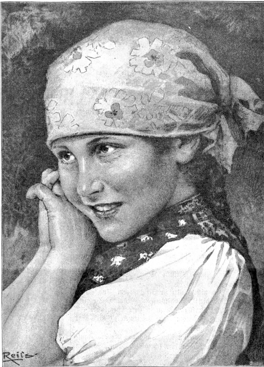
S' Rösl. — Nach einer Zeichnung von Sris Reiß.

„Nun noch die infame andere Geschichte. Lieber Pastor, ich könnte die Sache ja einfach dadurch aus der Welt schaffen, daß ich Frau Nautilus das in dem Böschungsvertrag festgelegte Vermögen glatt vergütete. Aber ein blanker