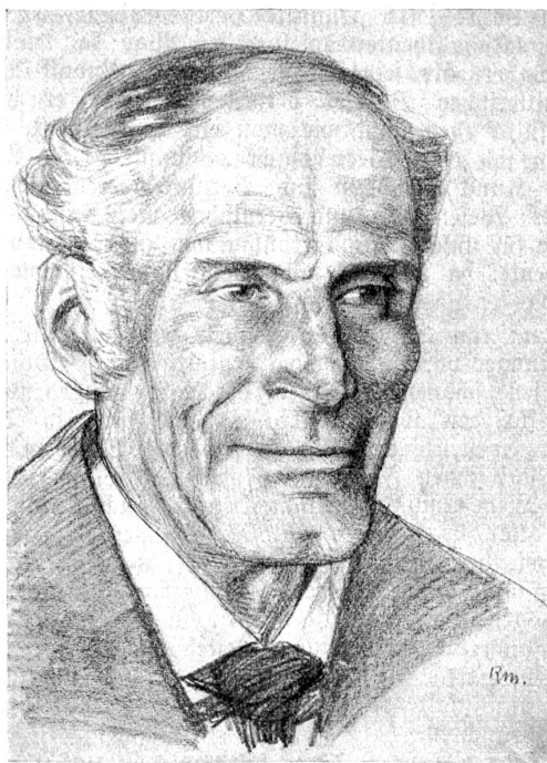
Porträtstudie aus Em. Sriedlis „Bärndütsch“-Bd. „Grindelwald“. (Verlag A. Francke Bern.)

Seine künstlerische Liebe aber galt dem „Gesicht“. Die „Gesichter“ waren die Hauptgegenstände seiner Arbeit an den 7 Bärndütsch-Bänden. Sie alle bezeugen: „Mein Innerstes kehrt du ans Licht des Tages mir entgegen.“ Mürgers Blicke waren Röntgenstrahlen, die zwischen festgelegten Zügen auch erst im Werden begriffene entdeckten. Die Retouche war bei ihm verpönt, Wahrheit ihm oberstes Prinzip. Darum das „Danke schön! söll das mü(ch) fii?“ einer