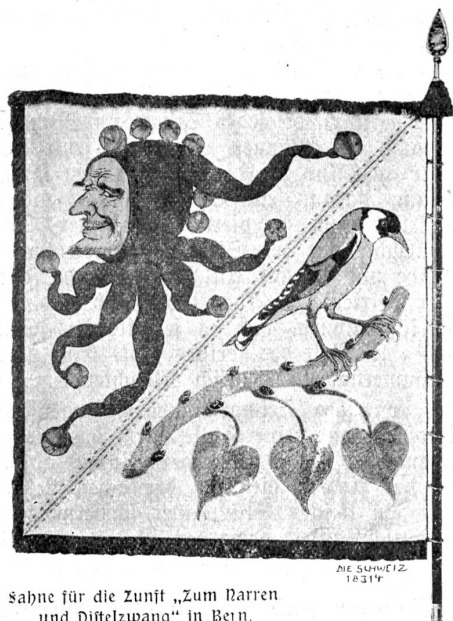
Sahne für die Zunft „Zum Narren und Distelzwang“ in Bern.

Auch der Trachtenkunde hat Mürger bis in seine letzten Tage sein Interesse zugewandt. Seine feinen Trachtenbilder in „Lüzelflüß“ und in dem ebenfalls vergriffenen