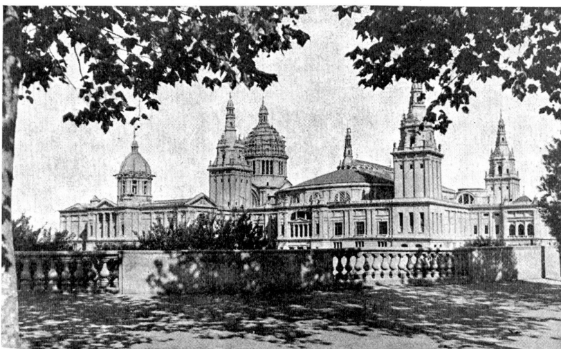
Weltausstellung in Barcelona. Außenansicht des auf der Ausstellung errichteten Palastes der Nationen.

Das alte Grimselhofpiz ist wohl vielen Bernern bekannt aus frühern Jahren. Wer kennt nicht die beiden Seelein in hochalpiner Umgebung, bereits 2000 Meter hoch und das niedere, gemächliche, massive Haus, das schon vielen Unterschlupf gewährt hat, sowie Speise und Trank, oft in kritischen Momenten? Doch die Zeiten haben sich geändert. Spielend sausen die eleganten Autos die Bergstraße hinauf und städtisch gekleidete Menschen sind heute keine Seltenheit