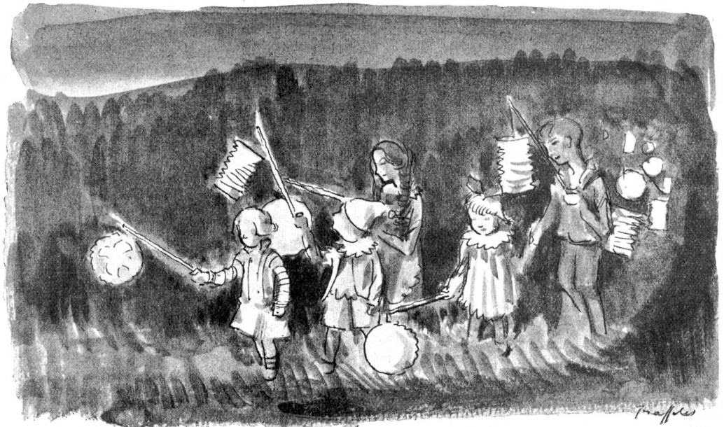
Augustfeier im Turbachtal.

(Nach einer Zeichnung von F. Traffelet.)