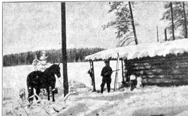
Unsere Jagdhütte am Rüdín-Lake.

Nun hatten wir Ferien, denn es bestand keine Aussicht, bald an den Nazko gelangen zu können, da in diesem Winter