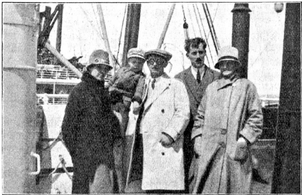
Auf der Hinfahrt.

figen Hotels der Schweiz ebenbürtig, und wir hatten Einzel- und Zweierkabinen. Die Bedienung war gut und zuvorkommend, bekam doch mein Junge jeden Abend und Morgen prompt sein Fläschli heiße Milch vom Steward ins Bett gebracht. An Unterhaltung gab es bei Tisch Konzert. Abends war im Palmengarten Tanz, zwei Abende Kino-