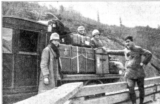
Transport unseres Gepäcks.

Am Samstag nachts kamen die Zollbeamten am Father Bint aufs Schiff und wurde dort die Post ausgeladen, so-