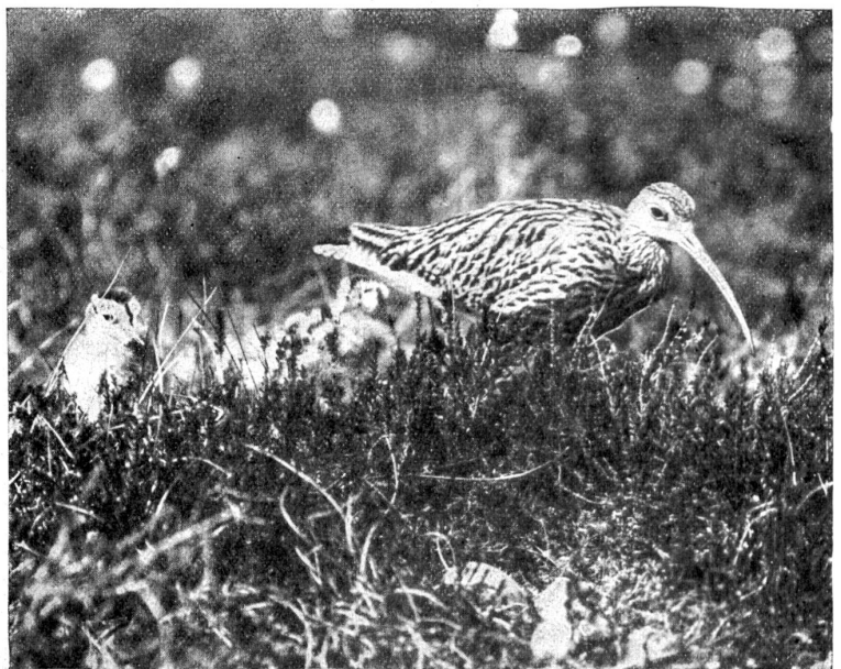
„Wenn Mutter geht, um das letzte Junge auszubüßen, gucken die Jungen über den Rafterand.“