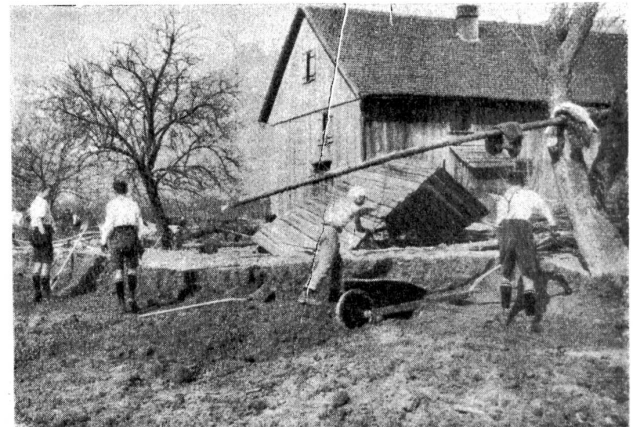
Sand! Sand! Man beachte die dicke Schicht.

Während alle andern Pfader hier in Ruggell wohnen, haben wir unser Kantonement im nahen Schweizerdorfe Grabs. Wir müssen schon um vier Uhr aufstehen. Mit unsern Fahrrädern gelangen wir bald auf den Arbeitsplatz. 5.30 Uhr. „Allons! enfants de la patrie!“, aber nicht mit Waffen, nein, bewaffnet mit Schaufel und Pickel. Hinaus auf die öde Sandwüste! Wir streifen an einem gefäulerten Felde vorbei, aha, das haben die wackern Basler im Frühling geleistet. Weiter. Sie und da ragen Baumstämme aus dem Sand, auch ganze Bäume, dann Balken von abgetragenen Hütten, sonst immer Sand, viel Sand! Was der Rhein nur alles hat mitlaufen lassen. Wir sind am Platze. 6 Stunden Arbeit liegen vor uns! Mutig, mutig, liebe Brüder... Schon fliegen die ersten Schaufeln Sand in die Rollwagen. Die Arbeit rückt, wir sind noch frisch. Aber merkwürdig, kein „Eingeborner“, kein Bauer bestellt sein Feld oder hilft mit, seinen Acker auszuebnen. Wir denken, natürlich, wenn man so einen lieben Fürst, einen freundlichen Millionär hat, da braucht man doch nicht zu arbeiten. Aber