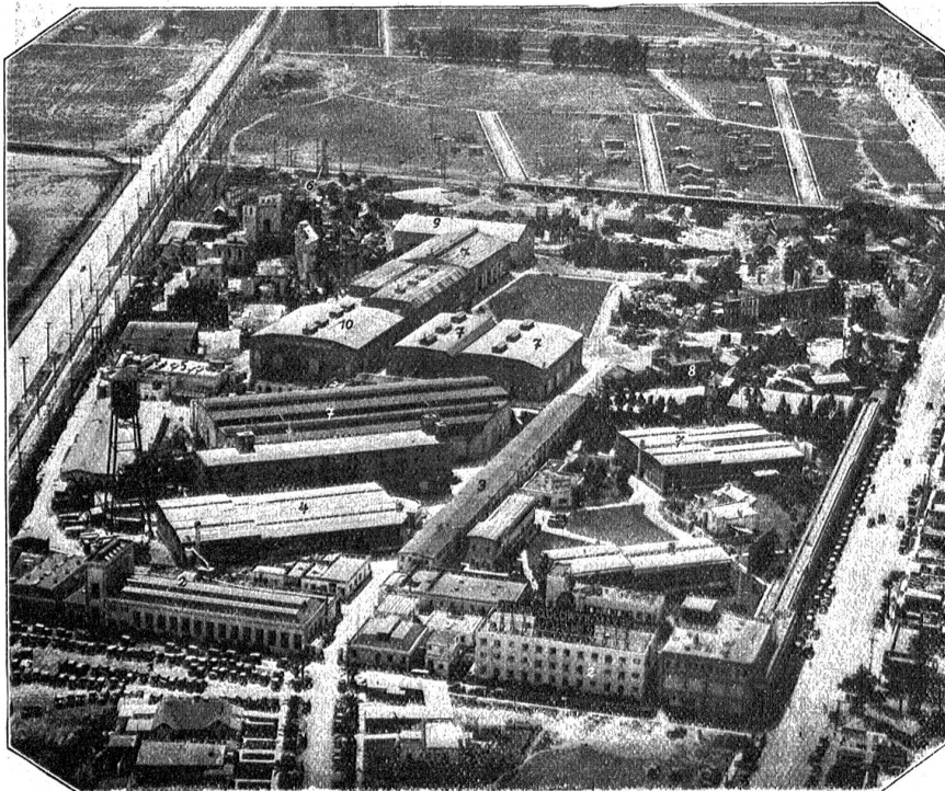
Der Gesamtkomplex eines typischen Großfilmunternehmens in Hollywood.

1 Autos der Angestellten; 2 Bürogebäude; 3 Garderoben und Büreaus; 4 Geräte- und Waffenarsenale; 5 Engagement-Bureau; 6 Film-Außenbauten; 7 Ateliers für Innenaufnahmen; 8 Regisseurbüreaus; 9 Technische Halle; 10 Schreinererei usw.