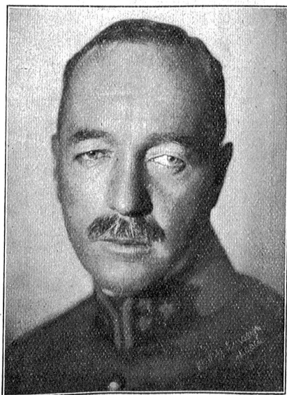
Oberst Ulrich Wille der neugewählte Kommandant der 5. Division.