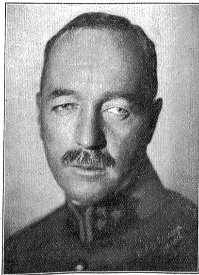
Oberst Ulrich Wille der neugewählte Kommandant der 5. Division.