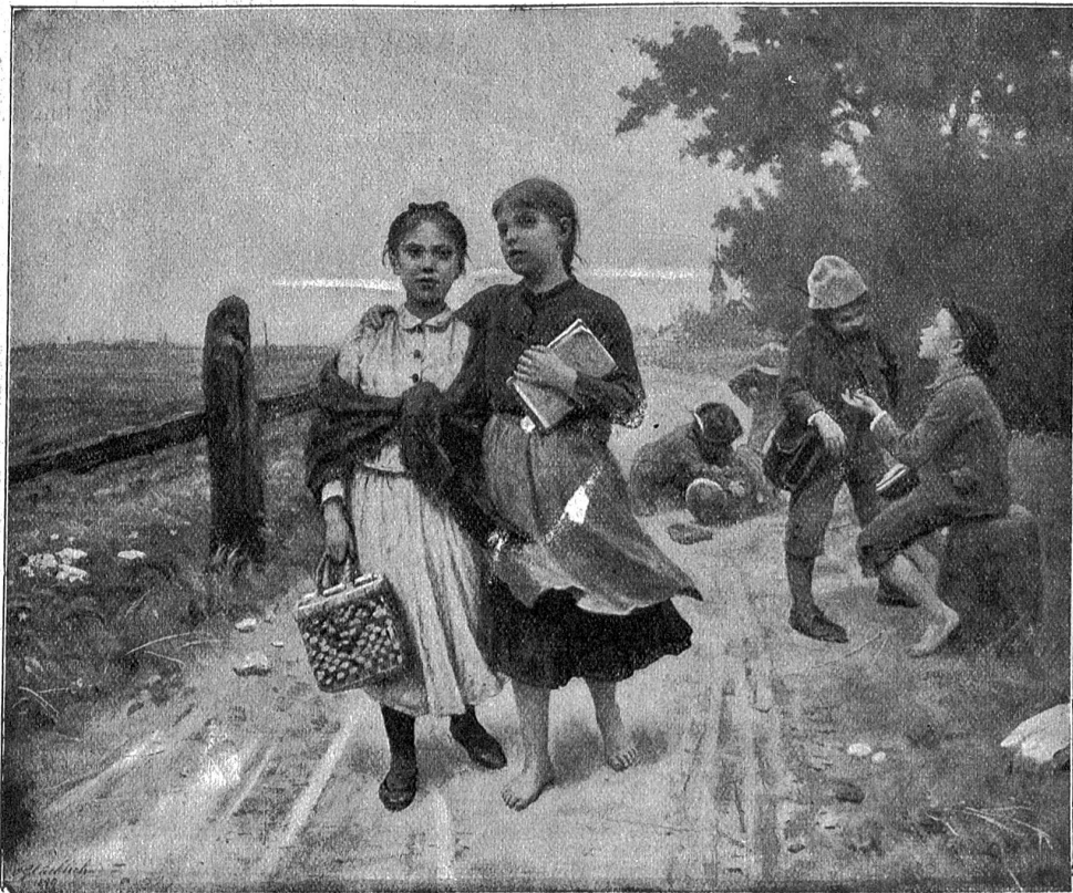
H. Glückl. „Sprohlicher Schulweg“.

„Ich kann mir nicht helfen, ich muß immer an den Sperling im Märchen denken, wie er dem Fuhrmann zu-