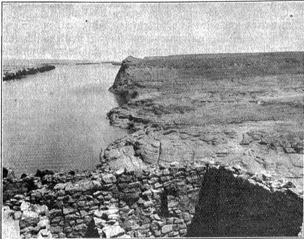
Kafr Ibrim, Ausblick.

Im Westen, wo die libysche Wüste bis an den Fluß herantritt, ist der kulturfähige Boden selten mehr als einige hundert Meter breit. Die Ufer sind dort zum Anbau weniger geeignet und auch weniger bevölkert als auf der östlichen Seite. Der Wüstenrand wird von den Nordwestwinden bis an den Rand des Flusses getrieben, so daß Anbau nur da möglich ist, wo Gebirgswälle den Sand-