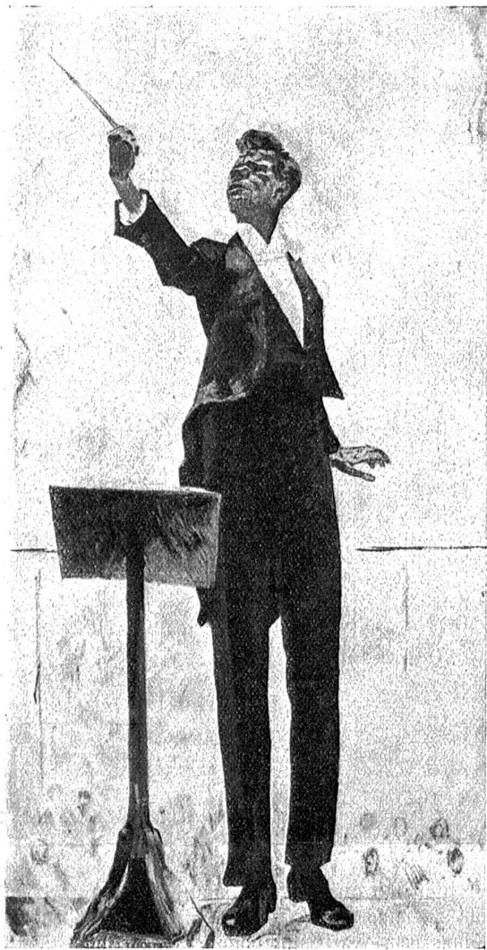
Cuno Amiet: Der Dirigent (1919).

veranstalteten Studienreise durch Ägypten und Nubien. Auf Grund und in Fortsetzung eines anlässlich der 41. Hauptversammlung im Schoße des Verschönerungsvereins der Stadt Bern und Umgebung, am 28. Februar abhin, über diese Reise gehaltenen Lichtbildervortrages, sei gestattet, an dieser Stelle auf die Reiseschilderung zurückzukommen, und zwar unter besonderer Berücksichtigung der Nilfahrt durch Unternubien.