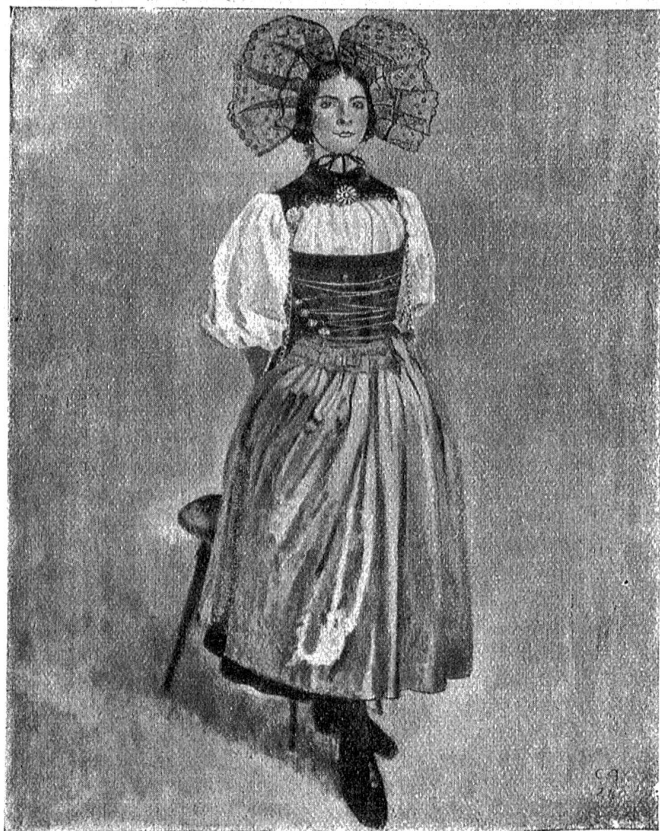
Cuno Amiet: Berner Mädchen (1924).

die hat Amiet mit seinem ureigensten Kunstmittel, mit der Farbe, glänzend zuwege gebracht. Keiner könnte ihm das so leicht nachmachen, keiner dürfte ihm das abschätzen.