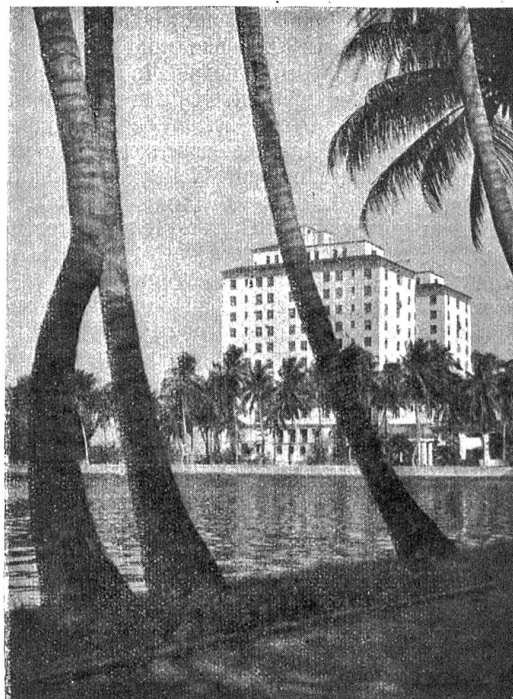
Palm Beach auf Florida. (Verkleinerte Illustrationsprobe aus Hoppé: Das romantische Amerika, Verlag Frey & Wasmuth, Zürich.)

kaum ein zweites imstande ist, uns die romantischen Schönheiten der Vereinigten Staaten eindrucksvoll vor Augen zu