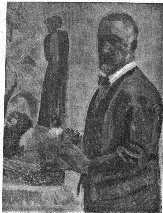
Cuno Amiet: Selbstbildnis.

Verlassen liegt Bad Blumenstein. Im Sommer werden hier die Menschen Erholung suchen. Jetzt braucht man keine Badefuren. Eine Schüssel jungen Salat, eine gehörige Nase voll Frühlingsluft, und man ist gesund! Ein hübscher Bauernbub zeigt uns den nächsten Weg nach Nebelschi. Querfeldein geht's. Man holt sich wohl einen tollen Schuh voll Dreck heraus, was tut's. Nun blinken die beiden Seelein herüber, die klaren, hellen Augen, in denen der trockige Kopf des Stod'orns sich spiegelt. Die Vorberge sind wie die modernen Dämchen; sie ziehen das weiße Röcklein weit über die Knie hinauf, und bald wird es nur noch ein Hemdchen sein, das ein frecher Windstoß über das Köpfchen weht und lachend ins dämmernde Tal hinunterwirft.