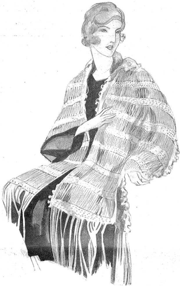
Shawl in Häkelarbeit.