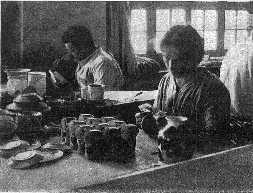
Dekoration der Tassen mittelst Abziehbildern; im Hintergrund Handmalerei.

Seite des Bodens nie flach ist, sondern immer etwas nach oben gewölbt. Man braucht dann eben nur eine kleine, ringartige Fläche von der Glasur zu befeien und beeinträchtigt nur unmerklich die Schönheit des Gegenstandes.