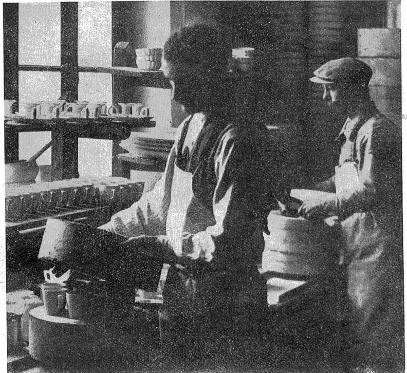
Verpacken der Tassen in feuerfeste Kapseln.

Der letzte Satz enthält nun schon die Andeutung von