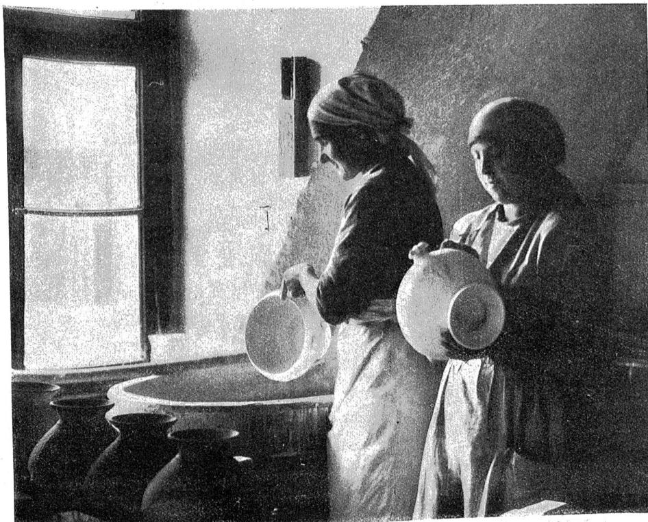
Glasieren des Porzellans.

Der folgende Prozeß ist die Glasur. Auf den ersten Blick scheint die Glasur ganz einfach: man taucht die Tasse in eine wasserähnliche Masse, schüttelt etwas, gießt aus, und schon ist die Sache fertig. Aber nur scheinbar. Denn nun zerstört der Arbeiter zum Teil das soeben ausgeführte Werk! An den Auf- lagestellen der Tasse entfernt er nämlich mittelst Lappen und Glaspapier sorgfältig alle Spuren der Glasur. Nur an den Auf- lagestellen. Würde man dies nicht tun, so wäre beim zweiten Brand ein Zusammenbacken der Tasse mit der Unterlage unvermeidlich. Die Auflagefläche jedes Porzellangegenstandes ist also un- glasiert. Man kann sich leicht davon überzeugen, indem man eine Tasse, einen Teller oder eine Schüssel hoch hebt und den Boden betrachtet und man merkt nun vielleicht, weshalb die untere