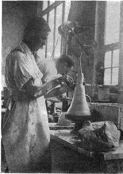
Der Hubel wird mittelst Messer vom Rest der Porzellanmasse losgetrennt.

denkliche Natur des Vaters aber totzuschelten. Und nebenbei glitt ein bedauernder Blick zu dem blaßwangigen Mädchen hinüber, das dem Vater allzu ähnlich sah in seiner