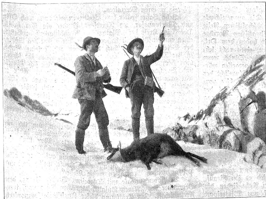
Die Gemsjäger.

Als ein ideales Skigelände müssen die Seitentäler der Simme bezeichnet werden, mit ihren Hängen und Kuppen, dann die lichten Höhen der Saanenmöser und vor allen Dingen die Gegenden des herrlichen Pays d'Enhaut, die rings von Bergen umgeben sind und Namen von bestem Klang aufweisen: Saanen, Gstaad, Chateau d'Yver. Aber auch Zweisimmen und Lenk