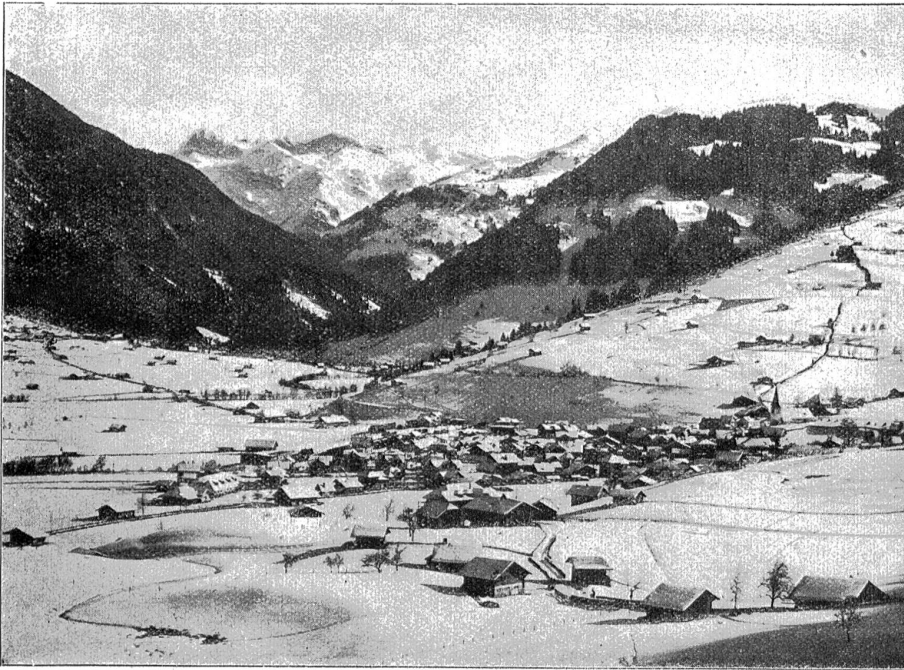
Zwieselmen im Winterkleid. — Phot. Müller, Zwieselmen.

einen Draht in den Erdboden leiten können. Warum kommt uns das nicht von Anfang an in den Sinn?"