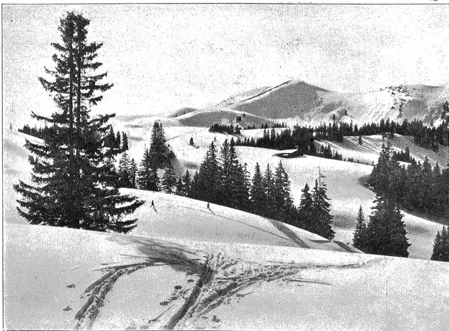
Am Hundsrück. Ideales Skigelände im Saanenland.

Viel besser war's auch in der Generation vor uns nicht. Immer noch bleibt die Liebe zum Winter in der Hauptsache platonisch; ein Eisballett ist am wirksamsten, wenn es auf der Bühne aufgeführt wird, und der Schlittschuhlauf dann am schönsten, wenn man ihm in Meyerbeers „Hugen-