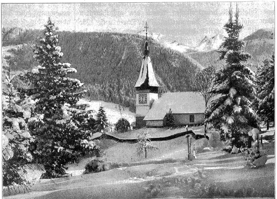
Das idyllische Bergkirchlein in Zwieselmen.