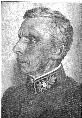
Oberstkörpskommandant Sprecher v. Bernegg.

Ueber die militärische Karriere Oberst von Sprecher haben wir sofort nach seinem Ableben berichtet; wir wollen nur noch einige Worte über seine bür-