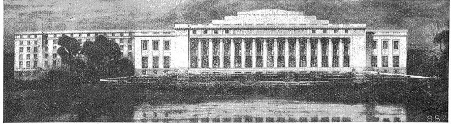
Entwurf für den Völkerbundspalast in Genf von den Architekten Henri Paul Renot (Paris) und Julien Slegener (Genf). (Wurde mit einem ersten Preis ausgezeichnet.)

Der 16. November ist dem Gedenken des heiligen Othmar geweiht, dessen Gemälde in der Stiftskirche zu St. Gallen zu sehen ist. Es stellt den Heiligen mit einem Weinfäßchen zu Füßen dar, denn Sankt Othmar wird zu den Weinheiligen gerechnet. Die Legende weiß folgendes zu berichten: Der um 759 als Abt des Klosters St. Gallen verstorbene Othmar hatte mit den Gaugrafen von Mëman-