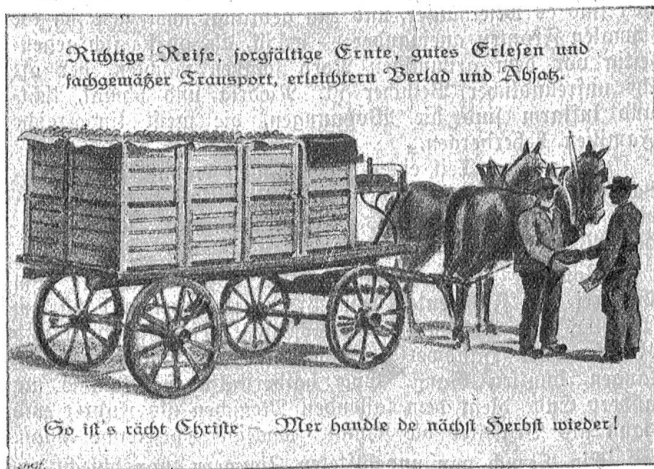
Richtige Reife, sorgfältige Ernte, gutes Erlesen und fachgemäßer Transport, erleichterten Verlad und Absatz.

Wie so anders das Erwachen des Tages hier in den Bergen, als drunten im Tiefland, am südlichen Meer. Wäh-