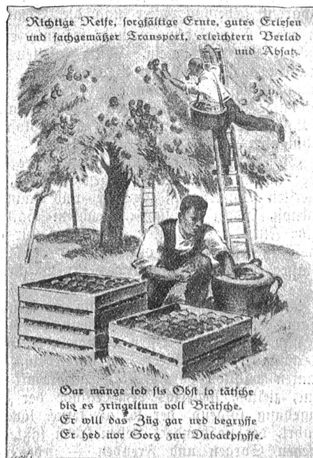
Richtige Reife, sorgfältige Ernte, gutes Erlesen und fachgemäßer Transport, erleichterten Verlad und Absatz.

sortiment und ein Zwergobstsortiment — wie als Augenweide. Dann sehen wir uns vordemonstriert die verschiedenen Verpackungsmethoden, die Einrichtungen des Obst-