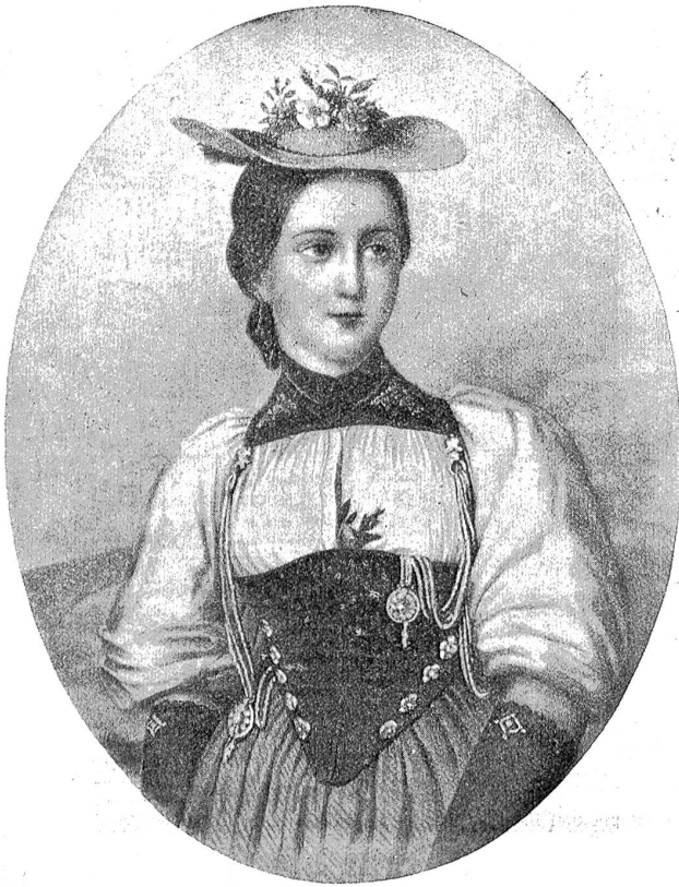
Brienzermittelschl in der Bernertracht (1825).

Neuenburg, Solothurn, Graubünden und Tessin vertreten sein, in geschlossenen Einheiten. Es wird seinen Charakter als ein Bernerfest behalten, mit einem erfreulichen eidgenössischen Einschlag, wie es sich für Bern gehört.