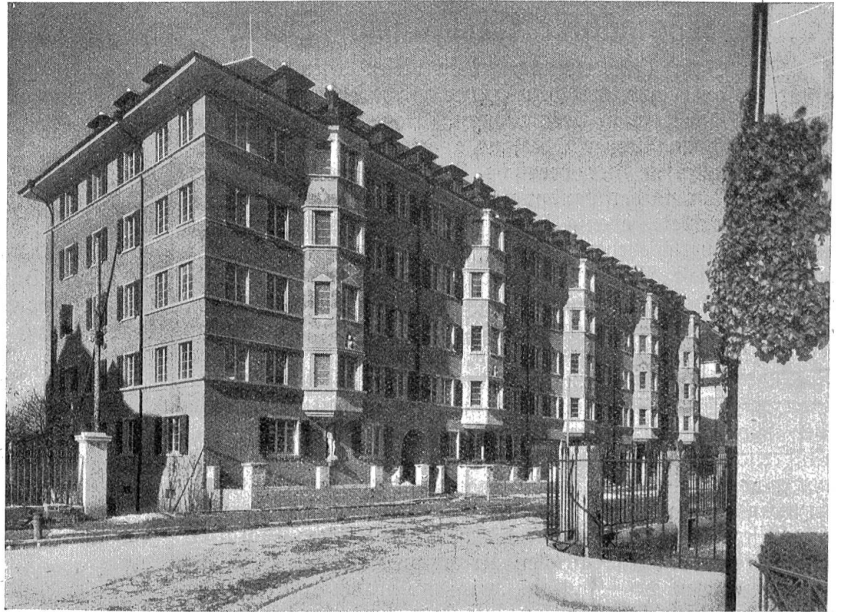
Wohn- und Geschäftshäuser an der Optingenstraße. — Architekten: Hans Weiß und Steffen & Studer, Bern.

Für den modernen Architekten gibt es ästhetische Gesetze ringsum. Die örtliche Tradition, der genus loci , will berücksichtigt sein; aber auch die Gegenwart mit ihren eigenen Bedürfnissen und Notwendigkeiten muß zu ihrem Rechte kommen. Der heutige Architekt muß vielfach mit bescheideneren Baumitteln auskommen als der der Vergangenheit;