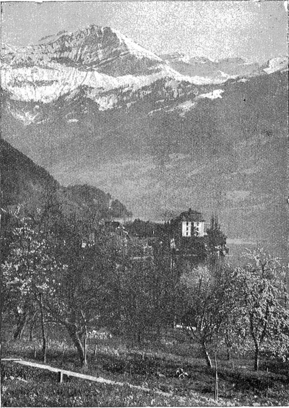
Merligen am Thunersee im Frühling.

„Ja, dies ist meine Lehre! Du hältst für Sünde, was wir getan, ich aber sage dir, solches glauben nur die Kinder des Teufels, und die Pfaffen bestärken sie in ihrem Teufelsglauben!"