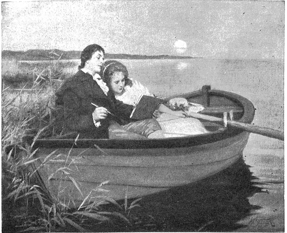
Abendlied. — Gemälde von Hermann Seeger.

„Wie lebt Glanzmann?“ Sprach er gutmütig, schwieg, als sie keine Antwort gab, beharrlich, schritt ihr voran