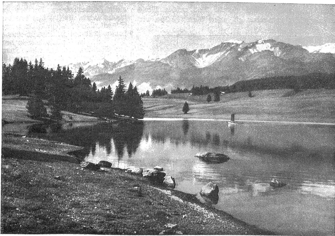
Monbrax bei Montana.

Marianne hustete, durch die Bäume ging ein leiser Windstoß, der Rasen legte sich in grüner Glätte seitwärts.