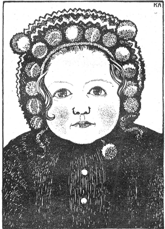
J. was für eine hoffärtige Kappe!

Selles Mädchenlachen hallt von irgendwo... und schon sind wir in der Stube beim Pius und schon kommt Oliva, den freundlichen Gruß erwidern: „Di Stuba ischt sewlig schwerri;