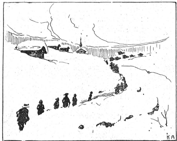
Lötſchental. Gang nach der Kühmatt,

Und nun werden die Bretter angeschnallt und hinab geht's zum Hochwald, zum wundersamen Marmordom, der keinen Abschluß finden will. Je höher ich klettere, um so stolzer, Kühner, unermesslicher scheint er noch an Größe und hinreißender Pracht zu wachen. Immer voller und triumphierender bricht von allen Seiten das blau — und goldig hereinflutende Licht in des Waldes Hallen, wogt um Altäre und Kapellen, Gefins und blinkenden Fensterreihen. Fliegt ein Vogel auf, so ist's als würde der Schneestaub zu dampfenden Weihrauchwolken — der Meßner klingelt — und auf die Knie sinkt alles in Andacht vor dem, der aus der Natur in erhabensten Schauern zu uns spricht. Wer noch niemals in den tief verschneiten Bergwald eindrang, vermag nicht den unsäglich gewaltigen Eindruck nachzufühlen. Wie heilige Schauer weht es uns da an. Glückseligkeit