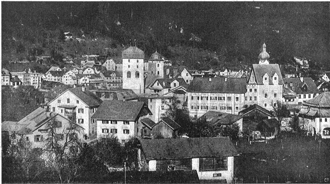
Jlanz im Bündner Oberland. — Man beachte die Patrizierhäuser mit den turmartigen Ausbauten, rechts das Haus Schmid von Grüneck, im Hintergrund die „Casa gronda“ mit dem Helmdachturn.

Der Mond war aufgegangen und beleuchtete ein paar Silberfäden in dem braunen seidigen Haar, das sie schlicht geflechtelt trug, schmucklos in einer Flechte um den Schildpattkamm gelegt.