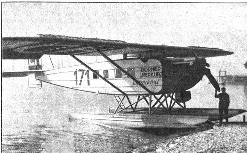
Das Dornier Flugzeug für Walter Mittelholzers Schweizer-Afrikaflug.

Eine zweimotorige Ausrüstung hätte allerdings die Betriebssicherheit erhöht, aber gleichzeitig die Abmessungen und das Gewicht vergrößert. Dadurch wäre auch der Tiefgang unworteilhaft beeinflusst worden. Ebenso ist es zweifelhaft, ob man mit einer größeren Maschine überall dort landen kann, wo ein kleineres Flugzeug ohne weiteres niedergehen darf. Uebrigens kann gesagt werden, daß die Expeditionsteilnehmer fast auf dem ganzen Wege Wasserläufe finden