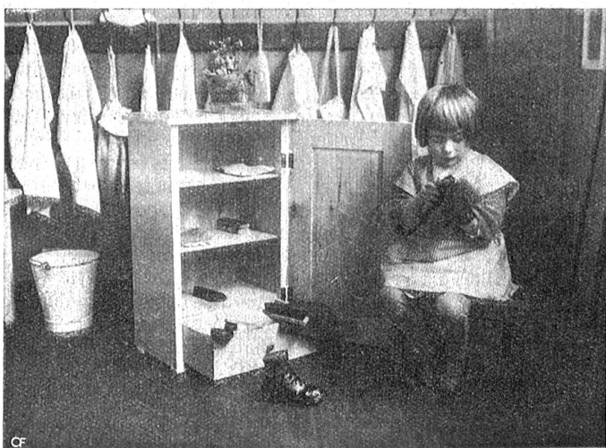
Aus einem Montessori-Kinderhaus.