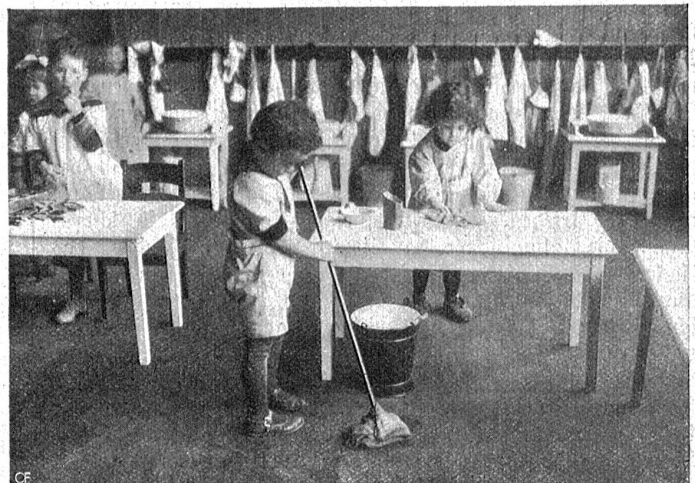
Aus einem Montessori-Kinderhaus.