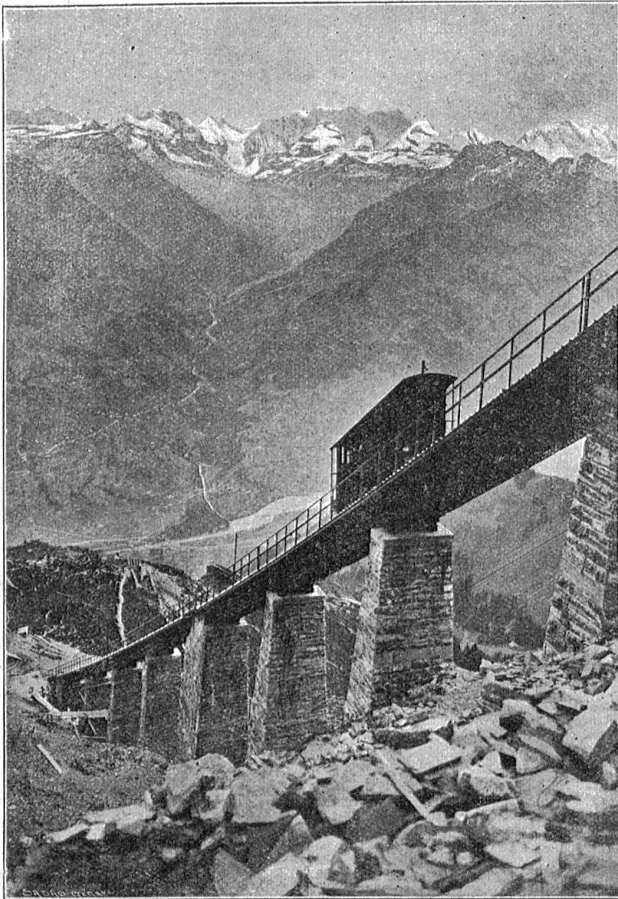
Miefenbahn. — Hegernalviadukt.

das längere Fernbleiben Deutschlands vom Völkerbund; denn jetzt handle es sich in erster Linie um den europäischen Frieden. Sollte in ihrem Sinne entschieden werden, dann würde sich wohl in der nächsten Zukunft der Genfer Weltbund zum europäischen Völkerbund zurückbilden.