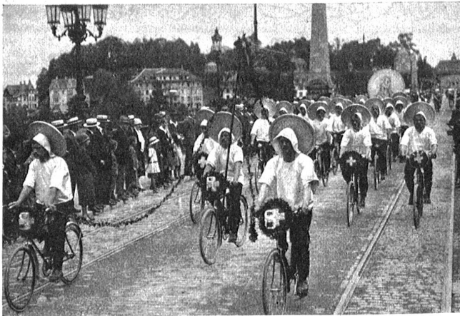
Velo-Club Schattdorf: Der neueste „Küßliber“.