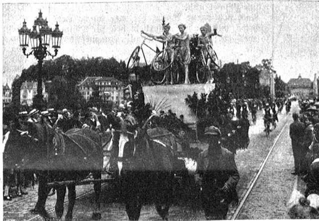
Bern, Cyclist's-Club Länggasse: Plastische Gruppe.

Gegen 40,000 Personen haben am Sonntag morgen mit Spannung in den geschmückten Straßen der Stadt dem prachtvollen Preistorso beigewohnt. Mit lautloser Stille fuhr der Festzug vorüber, es war ja ein Zug der Radler. Eine solche große Folge von mit größter Mühe und Arbeit ausgedachter Bilder hatte wohl niemand erwartet. Der eine Beloklub suchte sein Motiv in der Vergangenheit, der andere in seiner heimatischen Industrie und einige in der neuesten Zeit, alle waren aber höchst originell. Speziell erwähnen möchte ich den höchst geschickt dargestellten „Zafklub“ des H. B. Zürich, die Volkswiler mit „Wie der Berner vor 50 Jahren die Leinwand herstellt“, die Diepoldsauer mit der „Stickerindustrie“, Altdorf mit „Pro Zubentute“, Wohlten mit „Fröschenhochzeit“. Eine ganz hervorragende Idee hatten die Schattdorfer, die als lebende