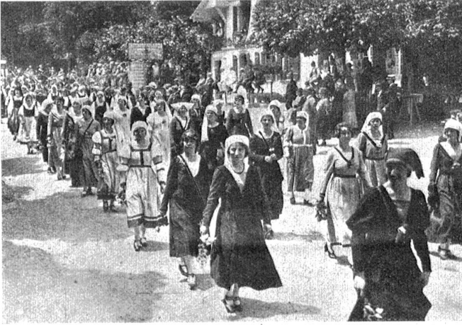
Sestzug: Gruppe der Bürgerinnen, Bäuerinnen und Fischerinnen.

Folgt der Gewaltthaufen: Zürich unter Anführung des ritterlich-stolzen Hans Waldmann, die Berner mit den Schult- heißen Niklaus von Scharnachtal und Petermann von Wabern an der Spitze, die Urner mit Aristier, Schwyzer, die Unterwaldner, Basler, Solothurner und Glarner; die Grenerzer mit ihrem Grafen, die von Chateau d'Ex und endlich eine Gruppe bernischer Lanzen-träger, gestellt vom Kavallerieverein Seebezirt.