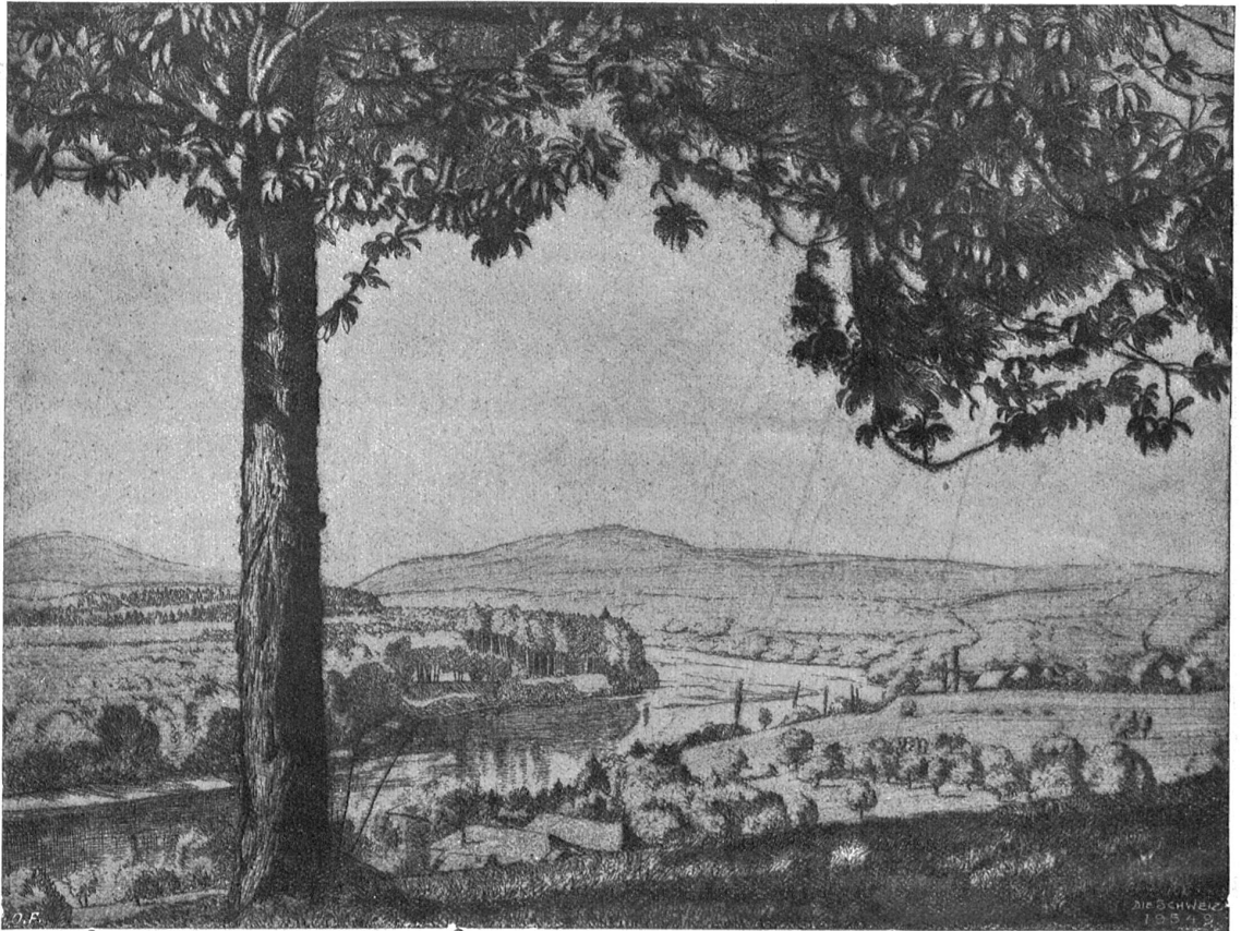
Arthur Riedel. — Rheinlandschaft.

„Und dann...?“ fragte er halb bang, halb im Gefühl, sie trachte nur, ihn auf diese Weise schneller loszu-