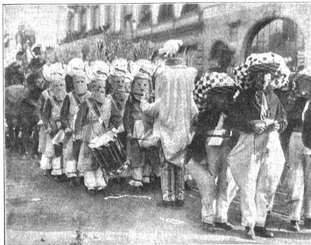
Gruppen aus dem Basler Fastnachtsumzug