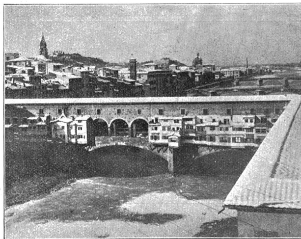
Abnorme Kälte und Schnee in Italien (vor ca. 14 Tagen). In Florenz hat die Kälte acht Grad unter Null erreicht. Das Bild zeigt einen Überblick über die „Ponte Vecchio“ und den zugefrorenen Arno.

Mehr als wir Schweizer trägt der Deutsche in sich die Sehnsucht nach dem Lande Taffos und Dante Alighieris.