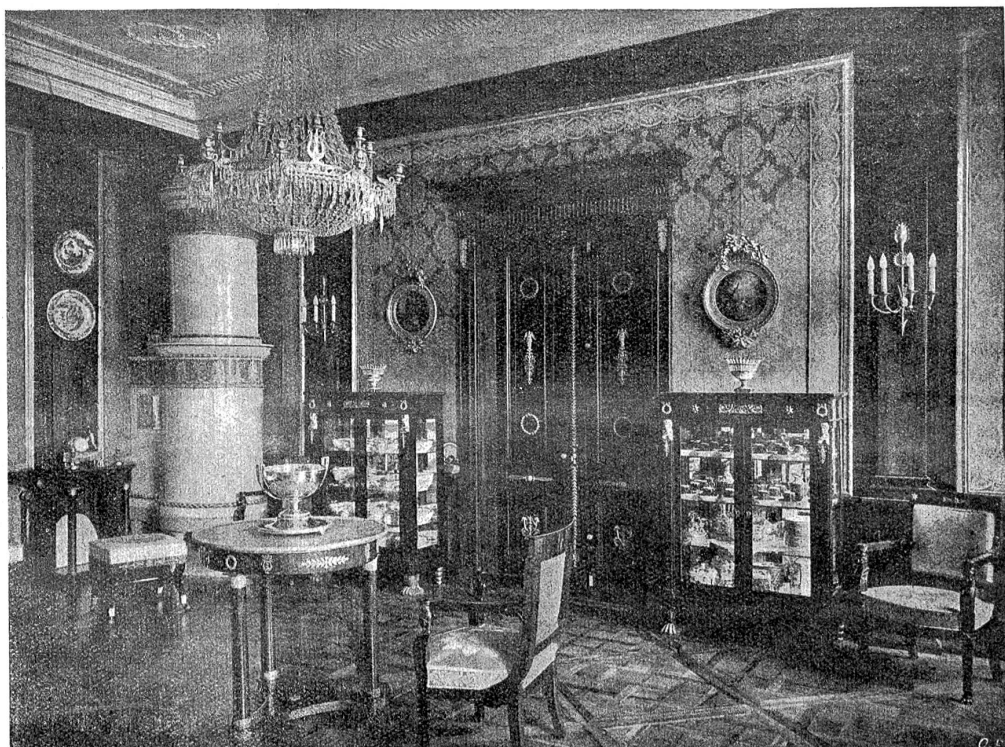
Kleiner Empire-Salon im I. Stock.

allen Kommissionen, zu- meist neben dem drauß- gängertischen General Sig- mund von Erlach und wie dieser streng ins Gericht fahrend mit den aufrüh- rerischen Bauern. Er half mit bei den trügerischen Verhandlungen auf dem Murfeld, zog als „Ge- neralauditor“ mit den Truppen ins Feld hin- unter nach Herzogen- buchsee, war Zeuge der unwürdigen Folterung und Hinrichtung der vier Rädelsführer (Sägesser, Flüdiger, Herzog und Blaser) zu Langenthal und half in den Verhand- lungen mit den Zürchern, die den Vertrag mit den Bauern geachtet wissen wollten, den harten Ber- nerschädel markieren. Da- mals ging kein milder Geist um im Frisching- Hause an der Junkern- gasse, und die Wände, wenn sie Ohren gehabt, hätten manch hartherziges und unchristliches Urteil