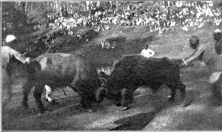
Die Silere packen an.

Hals, Nase, Ohre und Arme aber mit Silber bhängt, daß eim dünkt, ds Gwicht vo all däne Ringe und Schpange müß se z'Vode zieh. Nabeby gleit: es het ere mit verwandt nätte Gichtli! D'Manne hingäge mache de scho weniger Staat. Si chömen i irem drädige Wächtigwand und irem ständige Begleiter, der große Wasserpfufe.