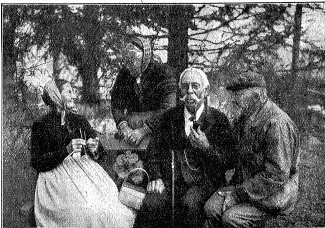
„Mir längwilen-is nid.“

Ich hatte gedacht, daß mein Entschluß feststünde und hatte nur einen Weg vor mir gesehen, der führte in die Heimat und in den Lehrerberuf, in ein Leben voll mühsamer, wenn auch reichlicher Arbeit für meine Mutter und meine Schwester. Und nun kam dies Anerbieten, riß die Tore auf und zeigte mir lockend eine Welt voll Glanz und Schimmer. Sorglos studieren dürfen und dann ein Leben „auf der Menschheit sonnigen Höhen“! Ich war jung, und das Künstlertum in mir war stark und machte