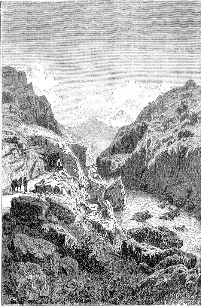
Das Urnerloch. Eingang in die Schöllenen.