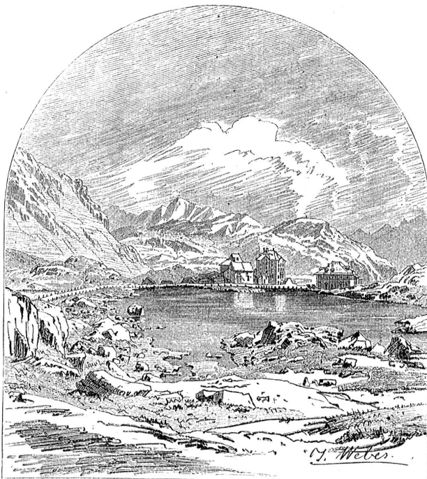
Das St. Gotthard-Hospiz.

nacheinander die folgenden Uebergänge stark begangen worden sind: der Brenner als direkteste Verbindungslinie zwischen Verona (Venedig) und München, im Westen der Große St. Bernhard, dann der Mont Cenis. In der zweiten Hälfte des 12. Jahrhunderts dominiert der Septimer. Aber nach 1197/98 wird wieder der Brenner der deutsche Paß nach Italien. Der Gotthard fällt völlig aus dem Spiel, die Schöllenen war im 12. Jahrhundert zweifellos noch nicht geöffnet.