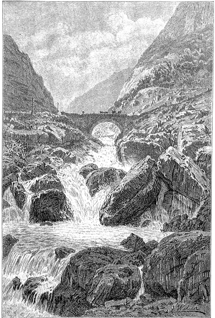
Partie in der Schöllenen.