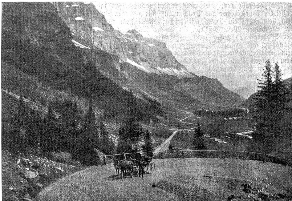
Der Arnerboden von der Jägerbalm aus.

Die Lau begrüßte sie wie sonst vom Brunnen aus, nur war ihr Gesicht von der Freude verschönt, und ihre Augen glänzten, wie man es nie an ihr gesehen. Sie sprach: „Wißt, daß mein Ehgemahl um Mitternacht gekommen ist! Die Schwieger hat es ihm voraus verkündigt ohnelängst, daß sich in dieser Nacht mein gutes Glück vollenden soll, darauf er ohne Säumen auszog mit Geleit der Fürsten, seinem Ohm und meinem Bruder Synnd und vielen Herren. Am Morgen reisen wir. Der König ist mir hold und gnädig, als hieß' ich von heute an erst sein Gespons. Sie werden gleich vom Mahl aufsteh'n, sobald sie den Umtrunk