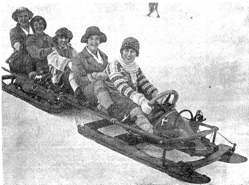
Studentinnen aus Oxford vergnügen sich beim Bobsleighsport.

Heute scheint dieses Spiel eine kleine zweite Auflage erhalten zu wollen. Die Türken haben in ihrer brutalen Art gegen alle Abmachungen und Vertragsbestimmungen den Patriarchen von Konstantinopel ausgewiesen. Dieser ist das höchste geistliche Haupt der griechisch-katholischen Kirche; er ist gewählt von den 19 Metropolitane und hatte seit jeher seinen Sitz in Konstantinopel, der ersten Metropole des Christentums. Die Griechen protestierten, mit ihnen die Orthodoxen in Bulgarien, Serbien und Rumänien. Sie erhielten aus Angora höhnisch kalten Bescheid. Die Türken stützen sich auf einen Entscheid der Auswanderungskommission, in der sie aber in der Mehrheit sitzen und der einen Unterschied macht zwischen der Person des Patriarchen — die unter das Auswanderungsgesetz falle — und dem Amt